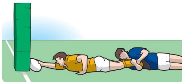
Toccato a terra contro un palo della porta