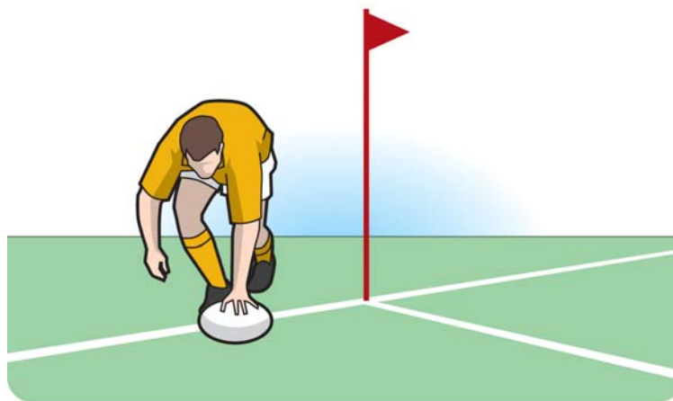
Giocatore in touch di meta, non portatore del pallone, che fa un toccato a terra e segna una meta