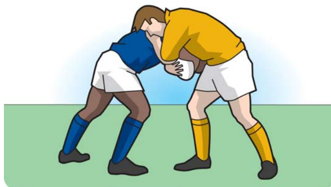
Maul non formato